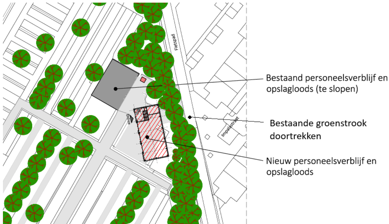
Afbeelding: bovenaanzicht oude en nieuwe locatie van de werkplaats.

Voor andere vragen over uw wijk kunt u rechtstreeks terecht bij Wijkbureau Zuid, 't Goylaan 75, via zuid@utrecht.nl of via algemeen telefoonnummer 14 030.