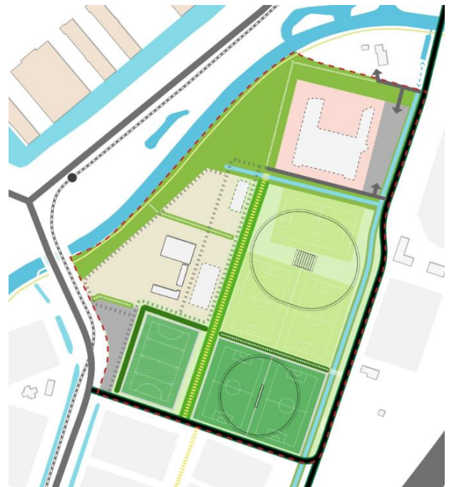
De voorkeursvariant voor de herinrichting van Maarschalkerweerd Noord

Na 21 april 2025 zetten we alle reacties op een rij. Iedereen die ons een reactie heeft gestuurd, krijgt van ons bericht. Uw vragen en opmerkingen verwerken wij, waar mogelijk, in de Variantenstudie of nemen we mee in het vervolg.