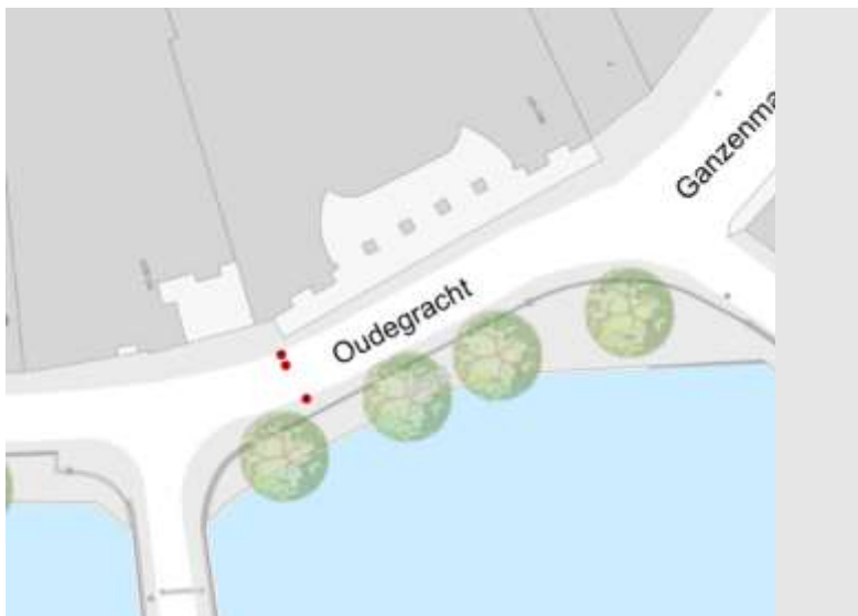
Op de Oudegracht zijn de paaltjes verder uit elkaar gezet (rode stippen)