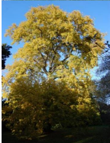
Fladderiep (Ulmus laevis). Op de plattegrond aangegeven met rode stip D