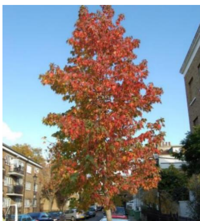
Amerikaanse amberboom (Liquidambar styraciflua). Op de plattegrond aangegeven met rode stip B