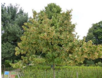
Gewimperde linde (Tilia henryana). Op de plattegrond aangegeven met rode stip C