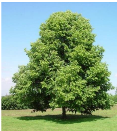
Winterlinde (Tilia cordata). Op de plattegrond aangegeven met rode stip A