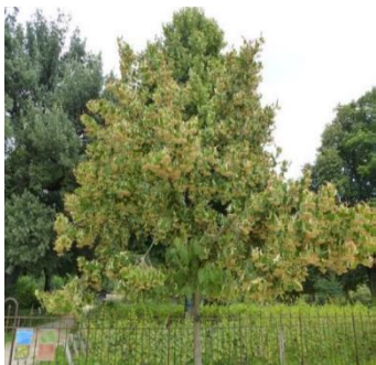
Gewimperde linde (Tilia henryana). Op de plattegrond aangegeven met rode stip C