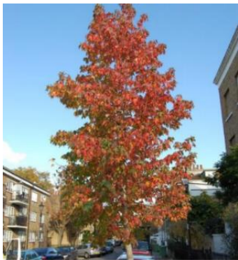
Amerikaanse amberboom (Liquidambar styraciflua). Op de plattegrond aangegeven met rode stip B