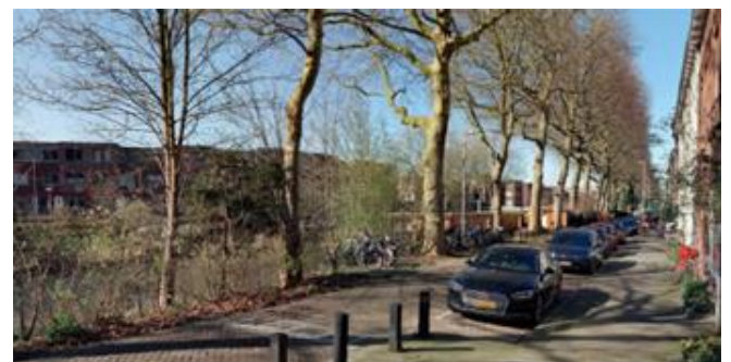
Locatie nieuwe ligplaats gezien vanaf de Billitonkade.