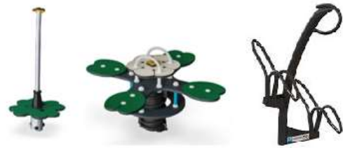
Figuur 2: de nieuwe speeltoestellen (draaitoestel en wipwap) en voorbeeld van een 'tulpfietsstandaard'