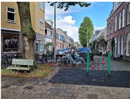
Figuur 1: Plein Nicolaasweg

Bewoners uit de buurt gaven eerder aan dat het plein wel toe was een opknopbeurt. We willen dit initiatief graag steunen en maakten vorig jaar twee mogelijke ontwerpen. U kon stemmen op het ontwerp van uw voorkeur. De pleinvariant had de meeste stemmen en is verder uitgewerkt.