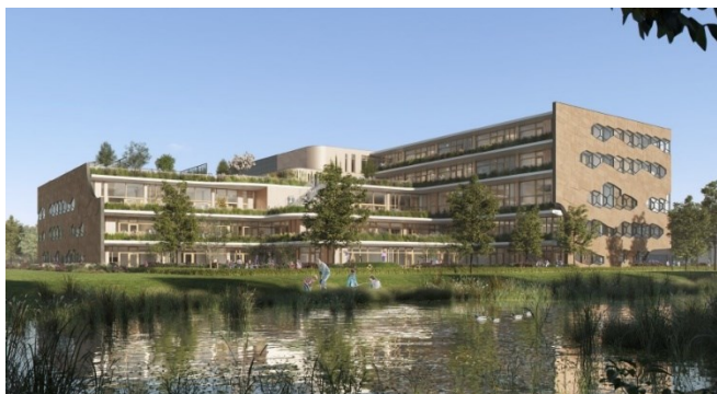
Impressie ontwerp achterkant van nieuwbouw ISU.