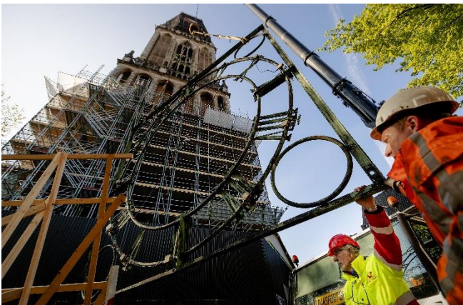
Verwijderen van de wijzerplaten in 2019

Op maandag 6 mei beginnen we om de vier wijzerplaten terug te plaatsen op de toren, op 55 meter hoogte. We starten om 05.00 uur in de ochtend. Dit doen wij zo vroeg, omdat we het werk in één dag willen uitvoeren. Dan is de overlast voor de buurt zo min mogelijk. Als het werk niet klaar is in één dag, dan maken we het af op dinsdag 7 mei.