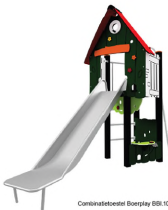
Combinatietoestel Boerplay BBI.101.HBR