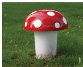
Paddenstoel Boerplay MNP.101.003