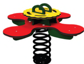
Kruiswip Margriet Boerplay BBI.716