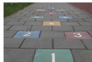
Hinkelbaan Boerplay DRD.DA.015