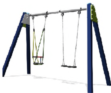
Dubbele schommel Boerplay BBP.030.1A