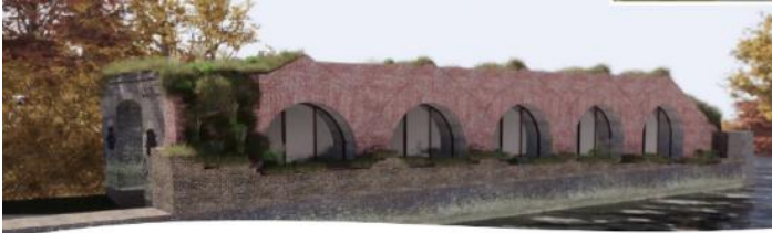
Impressie restauratie kazemat Lunet II

De forten Lunet I, II, III en IV krijgen een opknapbeurt. Begin april pakken wij de werkzaamheden aan de zuidelijke kazemat (bunker) op Lunet II weer op. We hebben gekozen voor een andere manier van restaureren dan bij de kazematten op Lunet I, III en IV. Hierdoor blijft de huidige uitstraling van het gebouw behouden. Deze werkzaamheden ronden we naar verwachting in de zomer af. Dan is de restauratie van de vier Lunetten forten helemaal klaar.