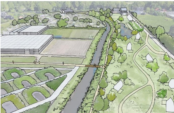
Impressie van het wandelpad langs de Oud Wulverbroekwetering

Voor de aanleg van een wandelpad langs de Oud Wulverbroekwetering, een wandelbrug en een natuurvriendelijke oever, zijn vergunningen aangevraagd. De watervergunning is verleend en de beslistermijn voor de andere vergunningaanvragen is met zes weken verlengd. Meer hierover en hoe u bezwaar kunt maken leest u op de projectpagina www.utrecht/lunettenpark.nl . Wij verwachten eind augustus 2024 met de werkzaamheden te starten, dit duurt ongeveer vijf maanden.