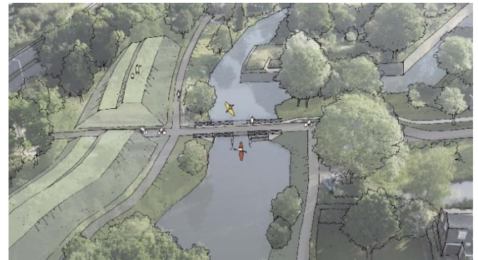
Impressie van de nieuwe brug en aarden wal

Het eerder gedempte verbindingkanaal tussen de fortgrachten van Lunet I en II wordt heropend. Om ruimte te maken voor de werkzaamheden en het water zijn enkele bomen verwijderd. De grond die we tijdens de werkzaamheden afgraven, gebruiken we om een aarden wal aan te leggen bij Lunet I, tussen de fortgracht en de Waterlinieweg. Deze 'traverse' is ook een historisch verdedigingselement dat we terugbrengen.