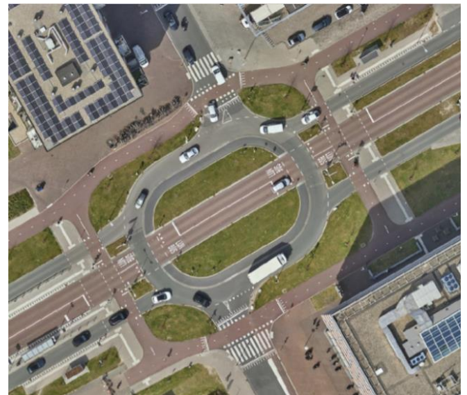
Afbeelding: luchtfoto ovonde Churchillaan