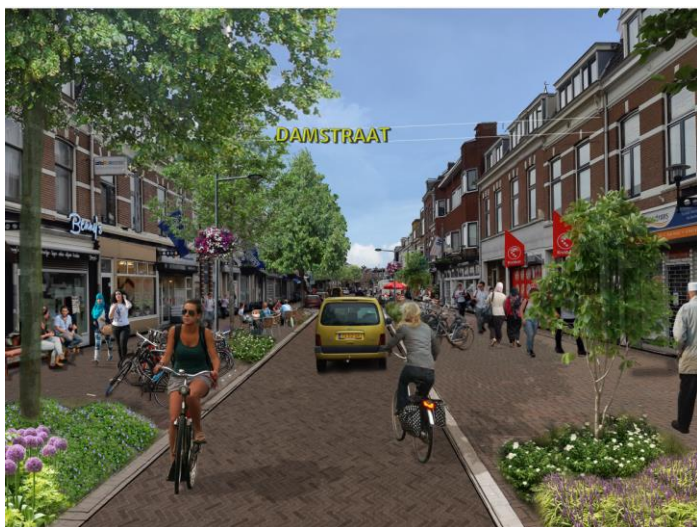
Afbeelding: Zo ziet de Damstraat er straks uit.

U ontvangt hierover later meer informatie. Op de afbeelding hieronder ziet u hoe de Damstraat er straks uit komt te zien.