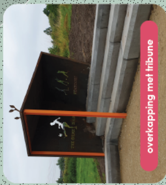
overkapping met tribune