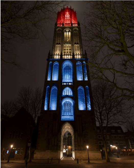
Impressie van gekleurde verlichting van de Domtoren. Kleurgebruik mag alleen bij bijzondere gebeurtenissen.

Verschillende delen van de toren kunnen straks apart verlicht worden. Ook kunnen we afwisselen in intensiteit en kleur van het licht. Feller en/of gekleurd licht wordt maar een paar keer per jaar toegestaan bij bijzondere (inter)nationale gebeurtenissen.