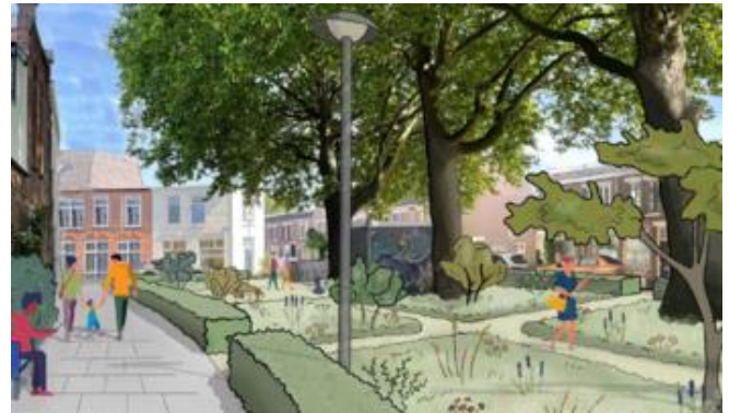
Figuur 1: visualisatie ontwerp plein aan de Egelantierstraat

tussen de Korenbloemstraat en Tijnstraat; en tussen de Amsterdamsestraatweg en de 2 e Daalsedijk. Zie ook de rode en gele markering op het kaartje op de achterzijde van dit bericht.