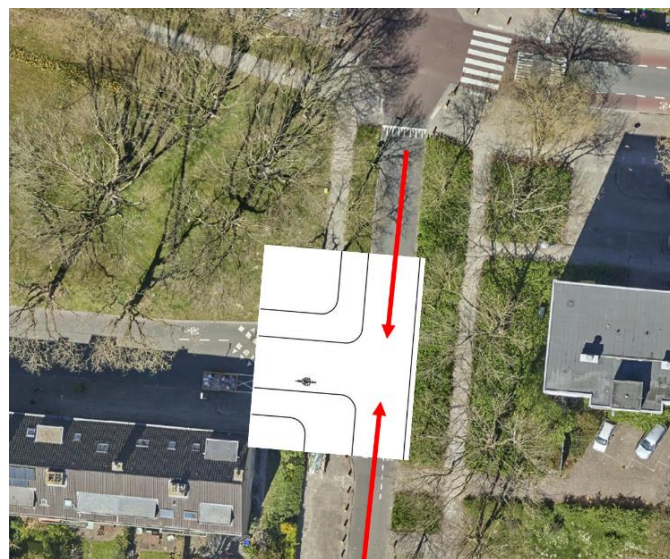
Figuur 1: Aanpassing kruispunt Wevelaan / Obbinklaan

Met andere vragen over uw wijk kunt u terecht bij Wijkbureau Noordoost, F.C. Dondersstraat 1, of via telefoonnummer 14 030.