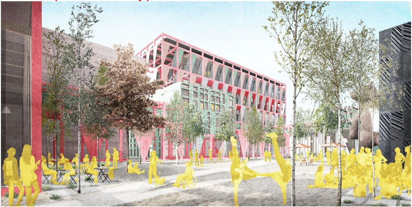
Afbeelding 1: Impressie binnenplein