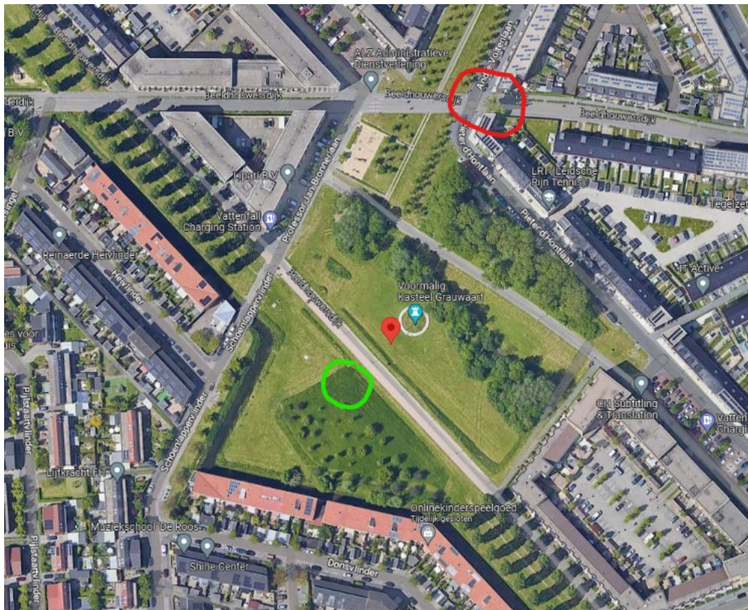
Locatie nieuwe boom (groen omcirkeld)