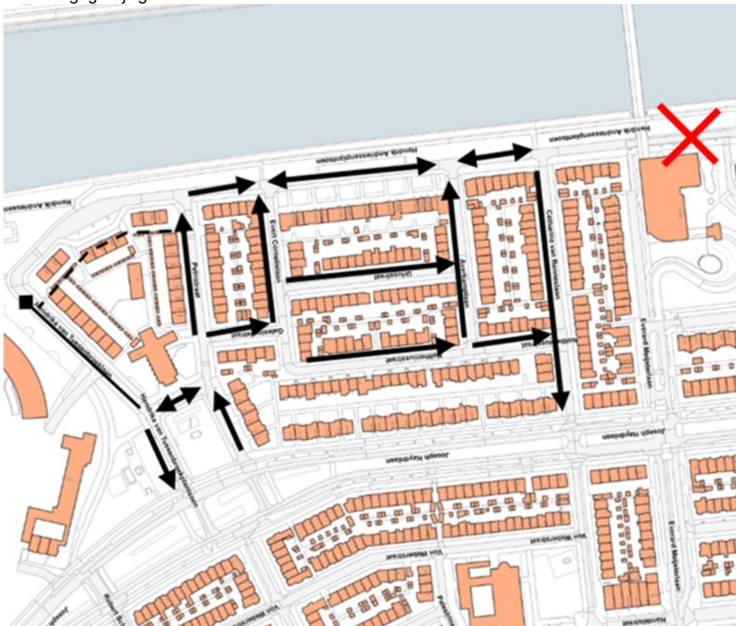
Afbeelding 2: Gewijzigde verkeerssituatie Halve Maan-Zuid