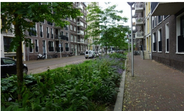
Inrichting Zijdebalen Utrecht als voorbeeld voor Welgelegen en Den Hommel.

Hoe we de straten in Welgelegen en Den Hommel het beste kunnen inrichten, wordt nu onderzocht. Het rioolsysteem krijgt twee buizen: één voor afvalwater en een aparte afvoer voor het regenwater. Het regenwater proberen we zo lang mogelijk vast te houden in het gebied voor warme, droge periodes. Ook willen we minder asfalt en meer klinkers gebruiken, zodat het regenwater beter weg kan lopen de grond in. Waar mogelijk willen we de rijbanen versmallen, zodat de snelheid van het verkeer wordt afgeremd en we ook meer groen in de straat kunnen toevoegen. Een voorbeeld hoe het kan worden, is te zien in onderstaand plaatje van Zijdebalen.