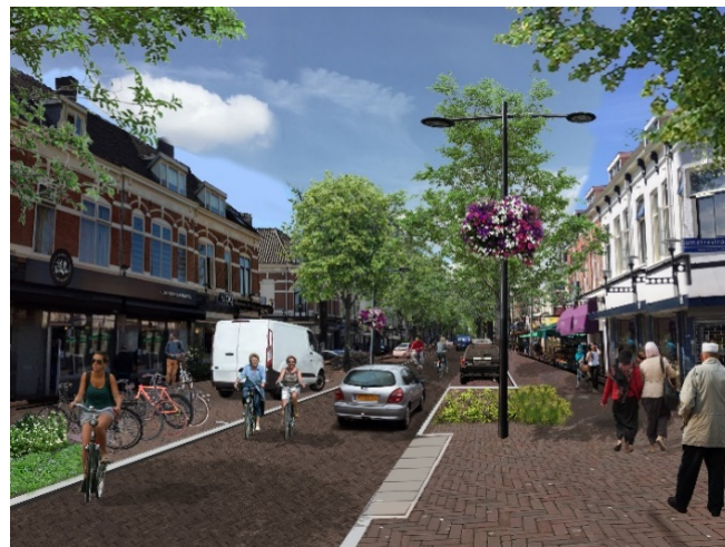
Afbeelding 1: Impressie nieuwe inrichting Kanaalstraat

Voor andere vragen over uw wijk kunt u rechtstreeks terecht bij Wijkbureau West, of via telefoonnummer 14 030.