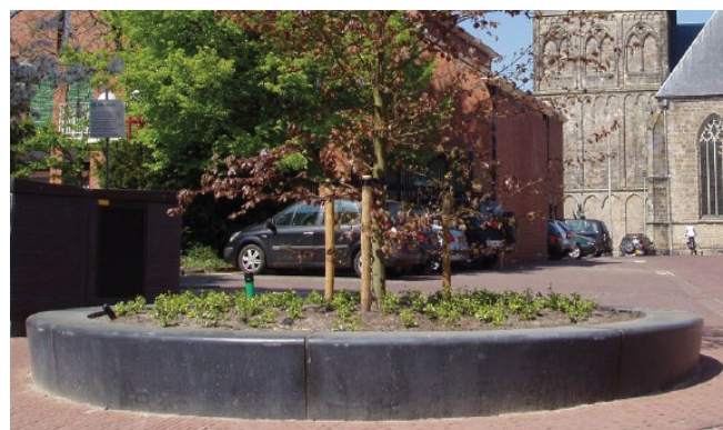
Afbeelding 2: Voorbeeld van een ronde zitrand met boom en beplanting bij Dialogobank