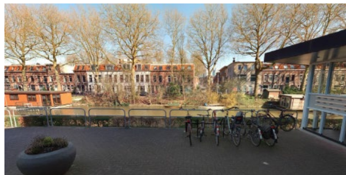
Locatie nieuwe ligplaats gezien vanaf overkant aan de Adikade.