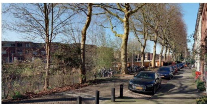
Locatie nieuwe ligplaats gezien vanaf de Billitonkade.