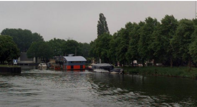
Locatie van de nieuwe ligplaats.