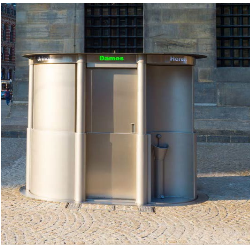
Afbeelding 1, urilift

Eerder zijn er drie uriliften geplaatst in de binnenstad. Een op de Mariaplaats en twee op het Janskerkhof. Deze drie combiliften, een combinatie van een wc voor vrouwen, twee urinoirs voor mannen en een handenwasgelegenheid, zijn sinds 2018 in gebruik.