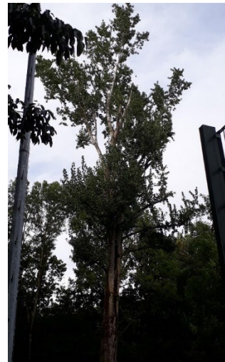
Populier 2008789 (sportvelden)

Wilt u meer weten over de kap van de bomen in uw straat? Dan kunt u contact opnemen met het Klantcontactcentrum via het telefoonnummer 14 030 of stuur een mail aan borg@utrecht.nl .