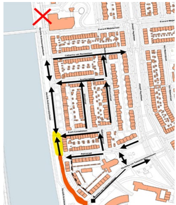
Afbeelding 1: Nieuw voorstel verkeerscirculatie