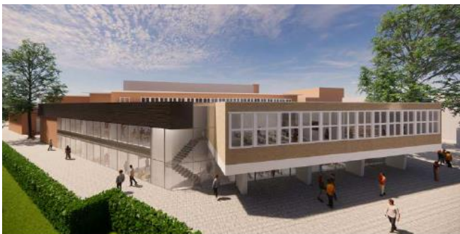
Een impressie van het verbouwde Christelijk Gymnasium

De school bestaat nu uit 2 losse gebouwen, het hoofdgebouw en het monumentale pand 'De Paddenstoel'. Deze gebouwen worden met elkaar verbonden met een atrium. Een deel van De Paddenstoel wordt gesloopt en weer opnieuw aangebouwd.