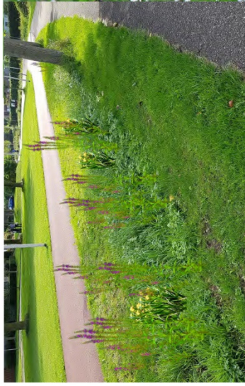
Accenten in beplanting