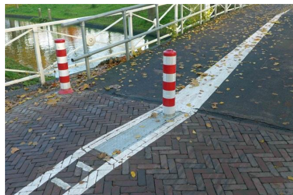
Referentiefoto beweegbare paal bij de Maliebrug.

De nieuwe paal wordt een beweegbare paal. Deze paal gaat niet recht de grond in, maar wordt neergeklapt in een bak, zie onderstaande afbeelding. Deze paal is alleen te bedienen met een sleutel.