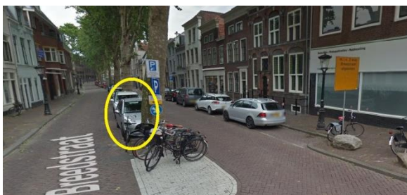
Nieuwe locatie laad- en losplaats Breedstraat

De laad- en losplaats wordt verplaatst naar de Breedstraat. Het voorstel is om de eerste twee parkeerplaatsen in de middenberm van de Breedstraat te bestemmen voor laden en lossen op maandag t/m vrijdag van 07.00 tot 18.00 uur. Buiten deze uren kunnen de twee parkeerplaatsen gebruikt worden voor betaald parkeren.