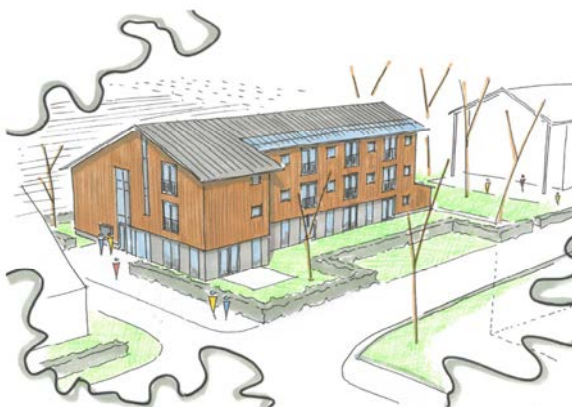
Impressie Ontwikkeling Pratumplaats.

Tussen kinderopvang Partou en Brouwerij Maximus komt een gebouw met 25 appartementen met gezamenlijke ruimtes voor zorginstelling Reinaerde. Het gebouw wordt 3 lagen hoog. De appartementen zijn voor mensen met een zorg- of ondersteuningsvraag waarbij zij door Reinaerde worden ondersteund. Het fietspad dat er ligt, blijft daar.