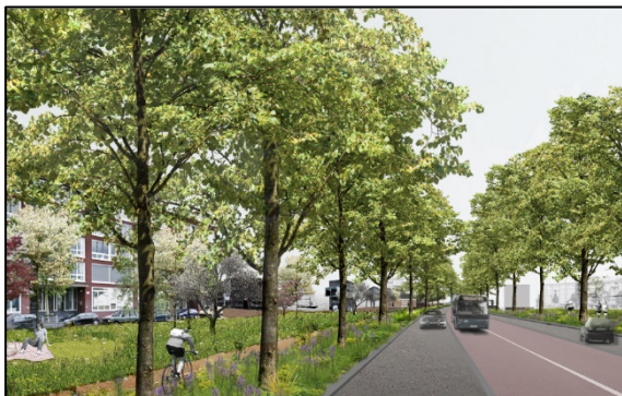
Afbeelding: Busbaan Dichterswijk en fietsonderdoorgang

Op de Kanaalweg wordt een fietsonderdoorgang aangelegd