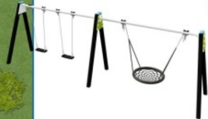
Schommel Wie komt het hoogst