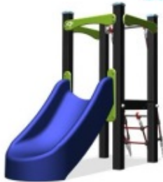
Klimleertent 0,6 m hoog, voor jonge kinderen