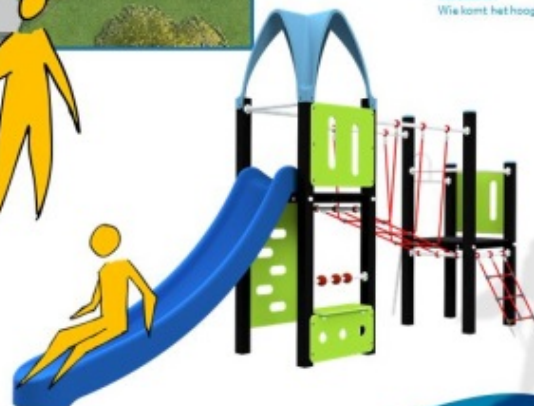
Klimkruissteek 1,5 m hoog, voor de wat oudere kinderen

Dit is een afbeelding van een conceptuele tekening. Het is een ontwerp van een speelplek met verschillende elementen. De afbeelding is bedoeld om de lay-out van de speelplek te illustreren. Het is een conceptuele tekening en niet een foto van een reële speelplek.