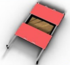
Afsluitbare zandbak Geen last van katten