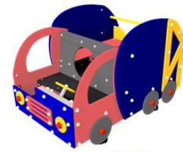
Vrachtwagen Samen de speelplek schoon houden