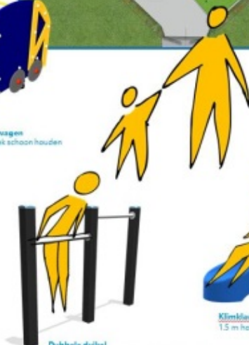
Dubbele stiel Met vriendjes en vriendinnetjes duikelen tot je er duizelig van wordt