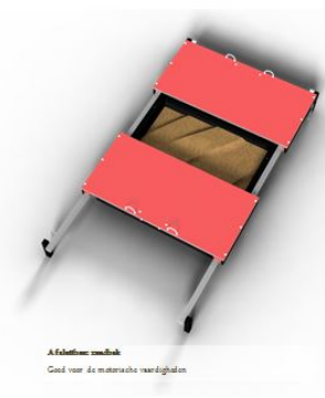
Afsluitbare zandbak Goed voor de motorische vaardigheden