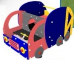
Vrachtwagen Samen de speelplek schoon houden