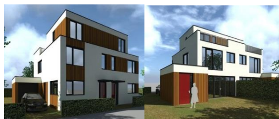
Impressies van de woningen