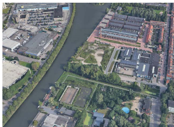
Figuur 2: Luchtfoto Befu en omgeving