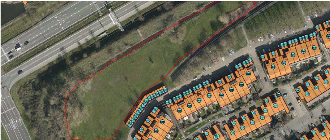
Locatie hondenspeelweide tussen Albert van Dalsum en snelweg A28 (vanaf kruising met Waterlinieweg richting Achimedeslaan)