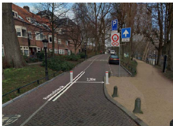
Impressie locatie verzinkbare paal op Hieronymusplantsoen

De werkzaamheden die nodig zijn op de paal te plaatsen duren naar verwachting 2 dagen. Door de werkzaamheden zal de doorstroming richting Kromme Nieuwegracht en vanaf de Nobeldwarsstraat worden gehinderd. Ook kunnen woningen en ondernemingen op de Kromme Nieuwegracht tijdelijk alleen bereikbaar zijn via de Nobeldwarsstraat.