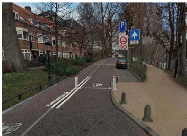
Impressie locatie verzinkbare paal op Hieronymusplantsoen

De smalle rijbaan en de scherpe bocht maakt de Kromme Nieuwegracht ongeschikt voor grote, brede vrachtauto's. De beweegbare paal zorgt ervoor dat voertuigen van 2.20 meter of breder niet meer via het Hieronymusplantsoen richting de Kromme Nieuwegracht kunnen rijden. Het Hieronymusplantsoen en de Kromme Nieuwegracht blijven wel bereikbaar voor personenauto's en bestelbussen (die smaller zijn dan 2.20 meter).