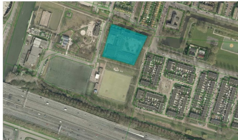
Fig. 2 Luchtfoto plangebied Pagelaan 1 en omgeving

De gemeente Utrecht staat positief tegenover woningbouw op deze locatie. Er is grote behoefte aan woonruimte voor gezinnen, starters en senioren. Op 13 juni 2017 heeft het college van burgemeester en wethouders een startdocument vastgesteld voor de herontwikkeling van Pagelaan 1 met woningbouw.