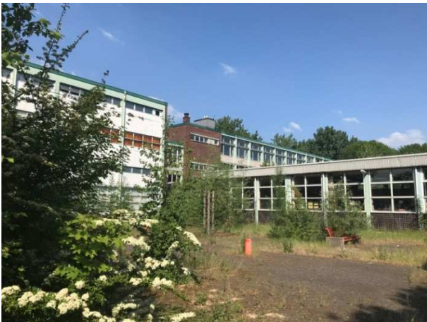
Fig 1. Voormalig schoolgebouw aan de Pagelaan 1

Op donderdag 6 september a.s. is er een inloopbijeenkomst voor het nieuwbouwplan aan de Pagelaan 1. De bijeenkomst wordt gehouden in Wijkbureau Zuid, aan 't Goylaan 75 in Utrecht. U bent van harte welkom om tussen 19.30 uur en 21.00 uur binnen te lopen.