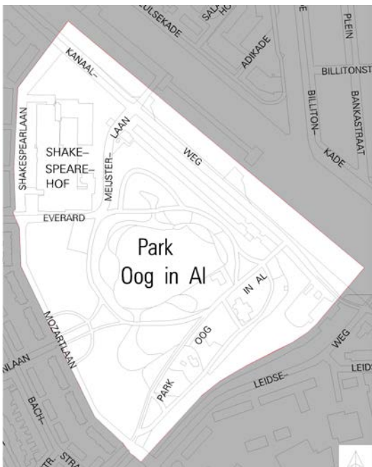
Betaald parkeren gebied per 1 oktober 2018