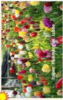
Tulpen 'Plukmeesters' Lubbe