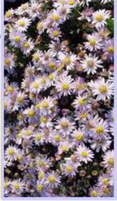
Aster ageratoides 'Stardust'