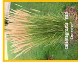
Calamagrostis 'Kant' Foerster