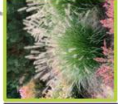
Pennisetum alb. 'Hamelin'