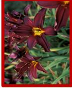
Hemerocallis 'American Revolution'