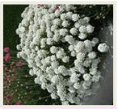
Iberis sempervirens 'Snowflake'