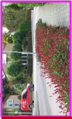
Pericaria amplexicaulis 'Lisan'