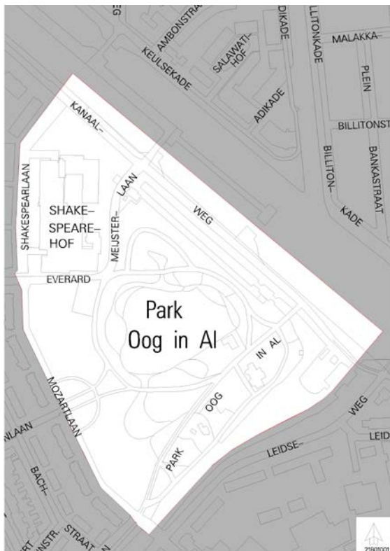
Gebied A Mozartlaan

U woont in gebied A Mozartlaan of gebied B Richard Wagnerlaan. In gebied A Mozartlaan liggen de straten Mozartlaan, Shakespearelaan, Shakespearehof, gedeelte Kanaalweg, Park Oog in Al en een gedeelte van de Everard Meijsterlaan. Bij gebied B Richard Wagnerlaan horen alle straten tussen de Mozartlaan en de Händelstraat met als grens Richard Wagnerlaan en een gedeelte van het Beethovenplein.