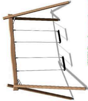
175575 Flora 2-pers. schommel