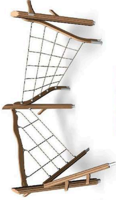
175590 Flora Klimwoud