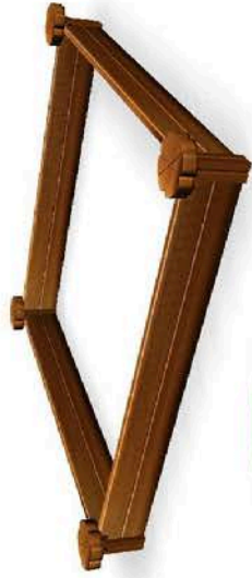
Q10400 Verdiepte Flora zandbak